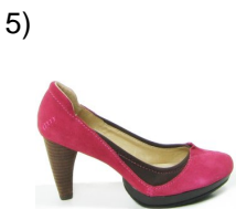
some short heeled shoes