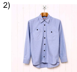
formal dress shirt