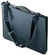
purse, pocket-book, portfolio